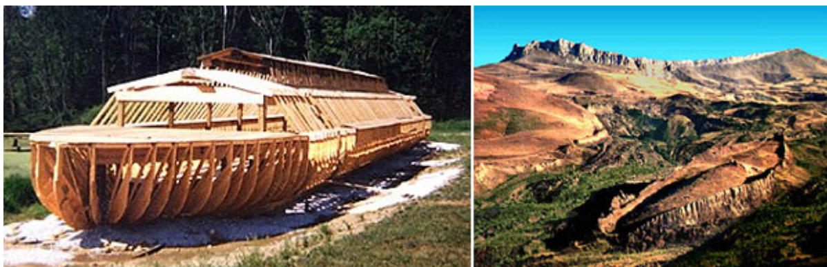
Rekonstrukce lodě a pohled na údolí kde se nachází Archa.