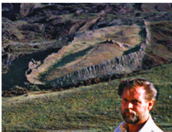
Noemova archa - předmět výzkumu na tomto místě potvrdil Ron Wyatt i vládní vědci

20. června 1987 Turecká vláda založila novou přírodní rezervaci Noemovy archy. To bylo výsledkem jednání vládní komise, která potvrdila desetiletý výzkum tohoto naleziště Ronem Wyattem a jeho kolegy.