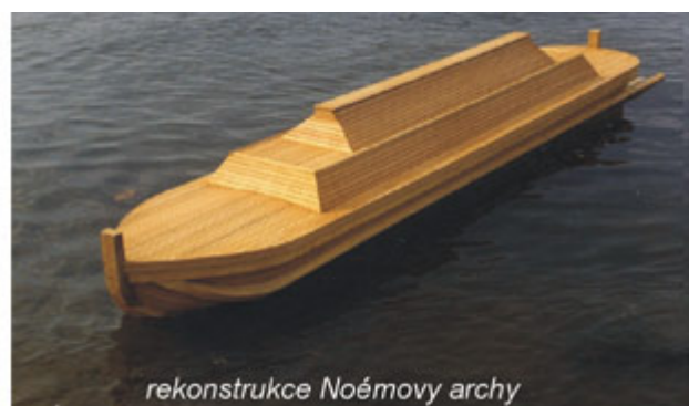
Posuv původního přistání archy a její posun. Rekonstrukce Noemovy archy.