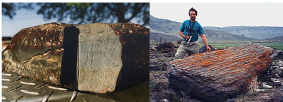
Vrstvené dřevo - tři výrazné vrstvy, potvrzeno laboratorní zkouškou. Na obrázku vedle je zkamenělé dřevo.

Zkoušky provedené v laboratoři Galbraith v Knoxville, Tennessee (USA) ukázaly, že vzorek obsahuje přes 0,7% organického uhlíku, což odpovídá zkamenělému dřevu. Vzorek byl kdysi živou látkou. Tenké plátky ze vzorku odhalily, že dřevo se skládá ze tří vrstev. Bylo to ve skutečnosti vrstvené dřevo!