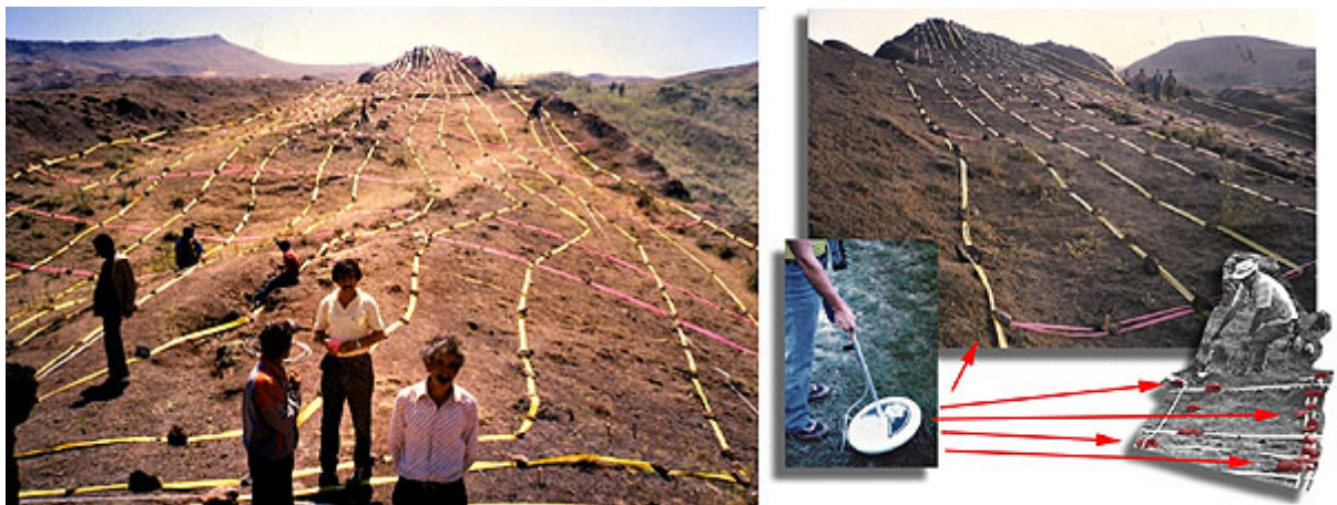
Železné linky - barevné pásky položené podél údajů kovového detektoru ukazují pravidelný vzorek železa, další potvrzení toho, že naleziště jsou pozůstatky ohromné konstrukce vyrobené lidmi a ne přírodou

V okolí naleziště jsou další unikátní místa pozůstatků. U vesnice Erzap je oltář Noemovy rodiny, který byl postaven jeho rodinou po potopě jako projev vděčnosti a na němž bylo obětováno Bohu. Nacházejí se zde hroby prvních rodin země po potopě, které jsou neskutečných rozměrů. U vesnice Uzengeli, kde je návštěvní centrum, jsou rozesety i tzv. závěsné kameny, které měly funkci stabilizátoru lodi při ohromném běsnění živlů. Mimo "údolí osmi" (pouze osm lidí přežilo potopu) též závěsné kameny, hroby velikých lidí (první lidé byli daleko většího vzrůstu), oltář Noemův, archa Noemova, atd. zde jistě spočívá ještě spousta předmětů, které zanikají v prachu věků.